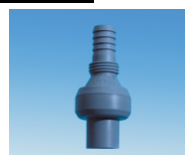
Rückschlagventil mit Entlüftung / non-return- valve with venting 3004.53.00