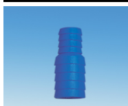
Entlüftungsstutzen / vent connection C1.0605.01